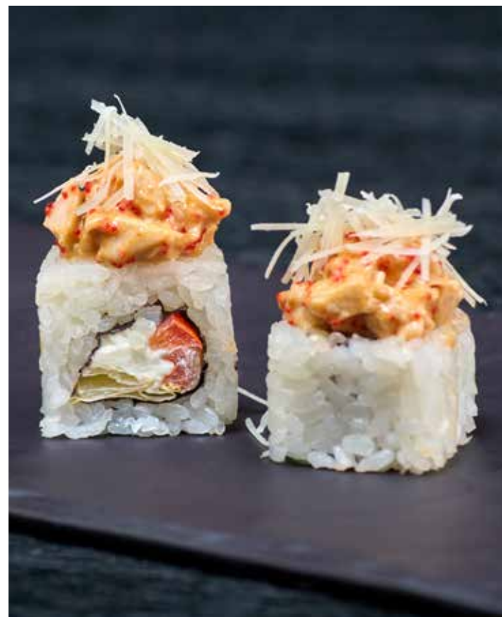
РОЛЛ ЦЕЗАРЬ 380 ₺ РОЛЛ С КУРИНЫМ ФИЛЕ, СОУСОМ ЦЕЗАРЬ, СЛИВОЧНЫМ СЫРОМ, СВЕЖИМ ПОМИДОРОМ, СОЧНЫМ ЛИСТОМ САЛАТА И ПАРМЕЗАНОМ. 250