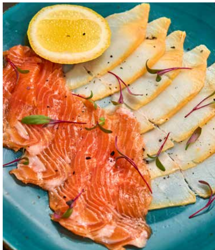
РЫБНОЕ АССОРТИ ФИЛЕ ФОРЕЛИ СЛАБОЙ СОЛИ, ФИЛЕ КОПЧЕНОЙ МАСЛЯНОЙ РЫБЫ. 690 Р 150