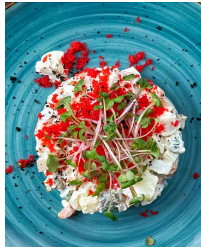
САЛАТ СНЕЖНЫЙ КАЛЬМАР САЛАТ ИЗ ОТВАРНОГО КАРТОФЕЛЯ, МОРКОВИ, ЯЙЦА, СОЛЕННОГО ОГУРЦА И НЕЖНОГО КАЛЬМАРА С ИКРОЙ ЛЕТУЧЕЙ РЫБЫ. 390 Р 270