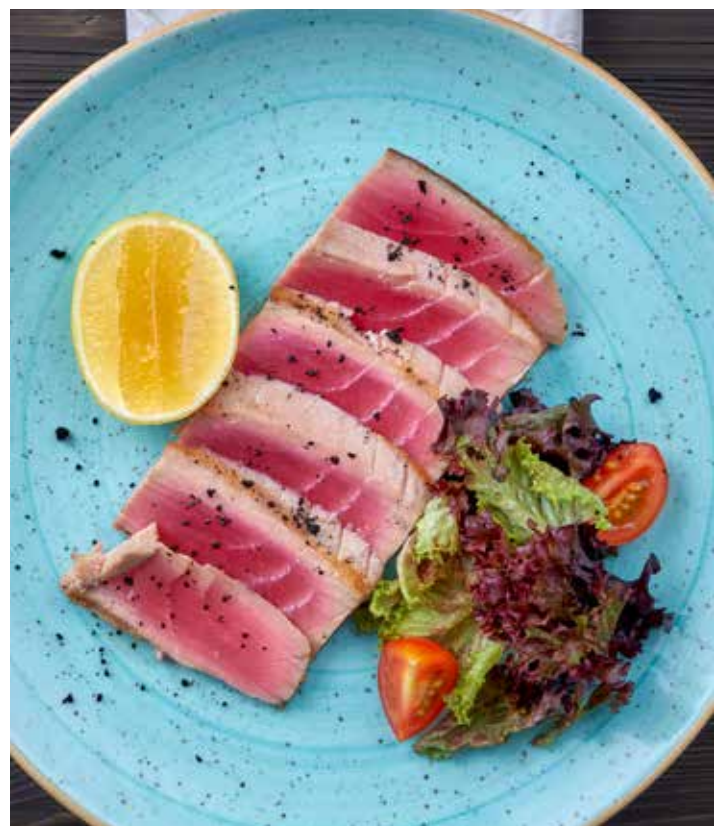
ТУНЕЦ-ГРИЛЬ НЕЖНЫЙ СТЕЙК ИЗ ФИЛЕ ТУНЦА ПРОЖАРКИ RARE, ПРИГОТОВЛЕННЫЙ НА ГРИЛЕ. 720 Р 140