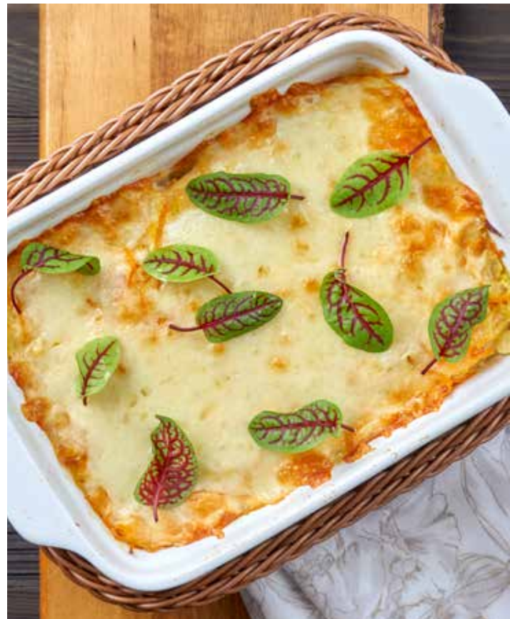
ЗАПЕЧЕННЫЙ СУДАК ФИЛЕ КРЫМСКОГО СУДАКА, ЗАПЕЧЕННОЕ С КАРТОФЕЛЕМ И КОРНЕПЛОДАМИ ПОД СЫРНОЙ КОРОЧКОЙ.. 620 Р 300