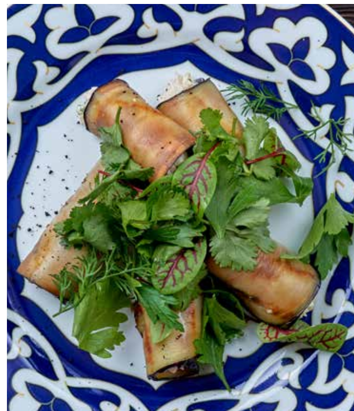
РУЛЕТКИ ИЗ БАКЛАЖАНОВ РУЛЕТКИ ИЗ БАКЛАЖАНА, ЖАРЕНОГО НА ГРИЛЕ, С НЕЖНЫМ ГРУЗИНСКИМ СЫРОМ, ОРЕХАМИ И КИНЗОЙ. 360 Р 240