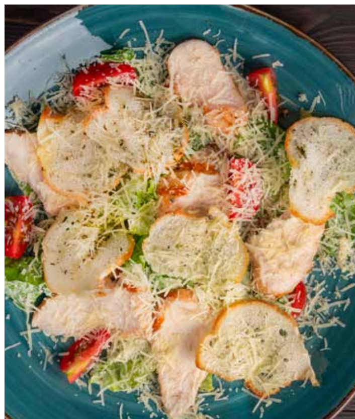
САЛАТ ЦЕЗАРЬ С КУРИЦЕЙ 460 Р 240