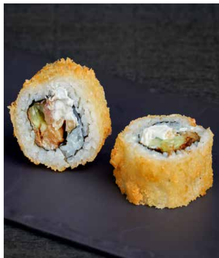
ТЕПЛЫЙ РОЛЛ ТАТАМИ 410 ₺ РОЛЛ В КЛЯРЕ ПАНКО С МАСЛЯНОЙ РЫБОЙ, СЛИВОЧНЫМ СЫРОМ, СВЕЖИМ ОГУРЦОМ, СТРУЖКОЙ ТУНЦА И СОУСОМ УНАГИ. 280