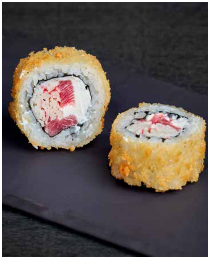
ТЕПЛЫЙ РОЛЛ ИМПЕРАТОРСКИЙ 420 ₺ РОЛЛ В КЛЯРЕ ПАНКО СО СЛИВОЧНЫМ СЫРОМ, ТУНЦОМ, СПАЙСИ КРАБОМ И СОУСОМ ТЕРИЯКИ. 280