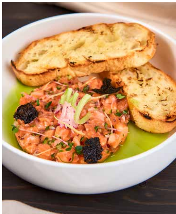
ТАРТАР ИЗ ФОРЕЛИ РУБЛЕННАЯ ОХЛАЖДЕННАЯ ФОРЕЛЬ СО СВЕЖИМ ОГУРЦОМ И КРАСНЫМ ЛУКОМ, ЗАПРАВЛЕННАЯ СОКОМ ЛИМОНА, ОЛИВКОВЫМ МАСЛОМ И СОЕВЫМ СОУСОМ. ПОДАЕТСЯ С ГРЕНКАМИ ИЗ СВЕЖЕГО БАГЕТА. 640 Р 160