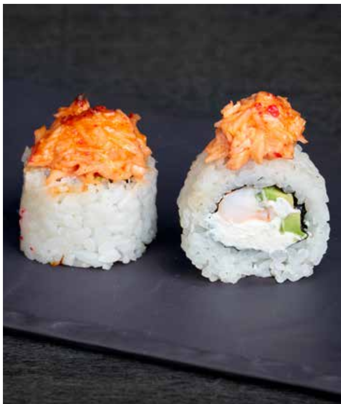
ЗАПЕЧЕННЫЙ РОЛЛ КОСТА-РИКА 460 ₺ РОЛЛ СО СЛИВОЧНЫМ СЫРОМ, ТИГРОВОЙ КРЕВЕТКОЙ, АВОКАДО И СПАЙСИ КРАБОМ. 270