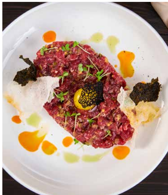
ТАР-ТАР ИЗ ГОВЯДИНЫ МЕЛКО РУБЛЕННАЯ ГОВЯДИНА С КАПЕРСАМИ, КОРНИШОНАМИ И КРАСНЫМ ЛУКОМ. ПОДАЕТСЯ С ПЕРЕПЕЛИНЫМ ЯЙЦОМ, РИСОВЫМИ ЧИПСАМИ И ХРУСТЯЩИМИ ВОДОРΟΣЛЯМИ НОРИ. 420 Р 150