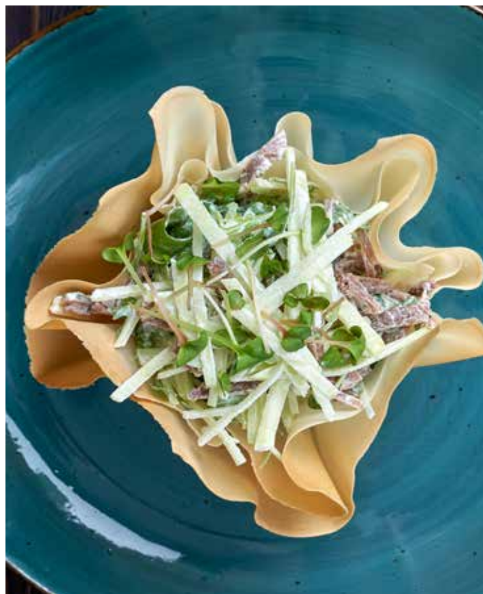
САЛАТ С ЯЗЫКОМ И ЯБЛОКОМ САЛАТ ИЗ НЕЖНОГО ГОВЯЖЬЕГО ЯЗЫКА, ЯБЛОКА И РУККОЛЫ С ДОБАВЛЕНИЕМ ЧЕСНОКА И ЛЕГКОЙ СМЕТАННОЙ ЗАПРАВКИ. ПОДАЕТСЯ В КОРЗИНКЕ ИЗ ТОНКОГО СПРИНГ ТЕСТА. 440 Р 160