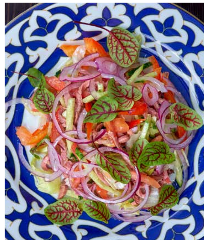
САЛАТ СУЛТАН САЛАТ ИЗ НЕЖНОЙ ТОМЛЕННОЙ ГОВЯДИНЫ С МИКСОМ СВЕЖИХ ОВОЩЕЙ: ОГУРЦА, ТОМАТА, БОЛГАРСКОГО ПЕРЦА, ЛИСТЬЕВ САЛАТА И КРАСНОГО ЛУКА. ЗАПРАВЛЕН ФИРМЕННЫМ СОУСОМ НА ОСНОВЕ КУНЖУТНОГО МАСЛА И ЧЕСНОКА. 510 Р 190