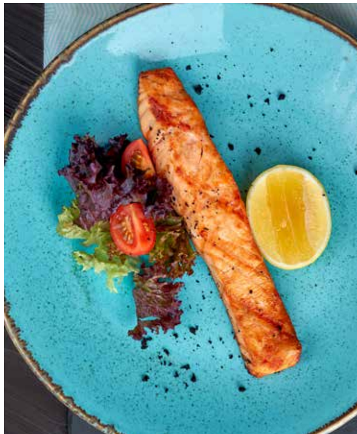
СТЕЙК ИЗ СЕМГИ СОЧНЫЙ СТЕЙК ИЗ ОХЛАЖДЕННОЙ СЕМГИ, ПРИГОТОВЛЕННЫЙ НА ГРИЛЕ. ПОДАЕТСЯ С ДОЛЬКОЙ ЛИМОНА. 910 Р 200