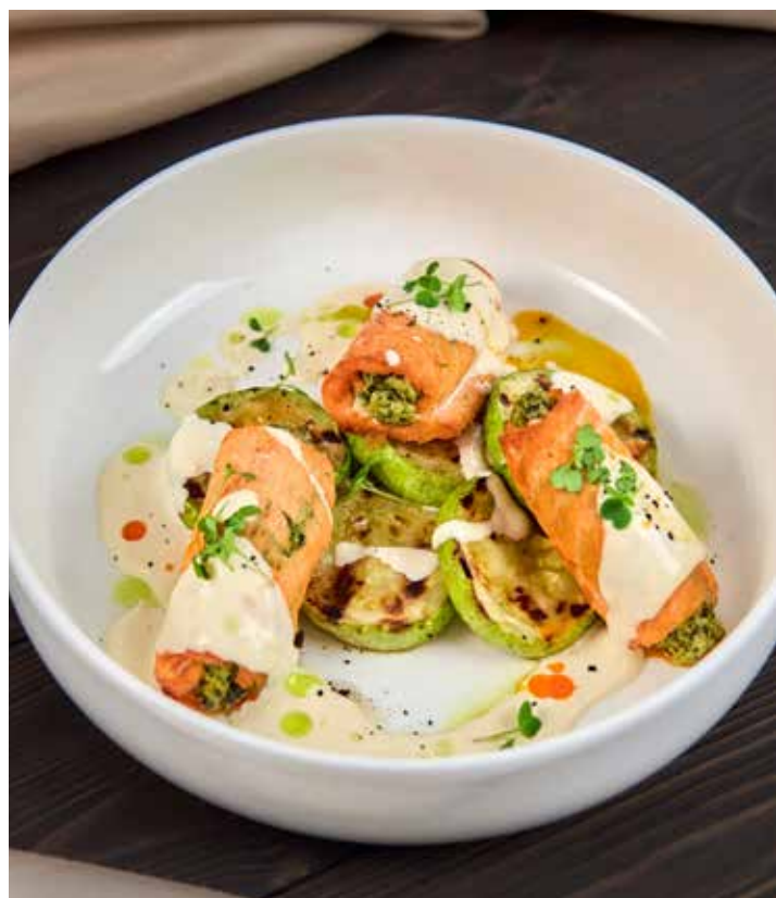
ФОРЕЛЬ БЕЙЛИЗ СОЧНЫЕ ЛИСТЫ ШПИНАТА И СЛИВОЧНЫЙ СЫР, ЗАПЕЧЕННЫЕ В СЛАЙСАХ ФОРЕЛИ ПОД НЕЖНЫМ СОУСОМ БЕЙЛИЗ. 890 Р 220