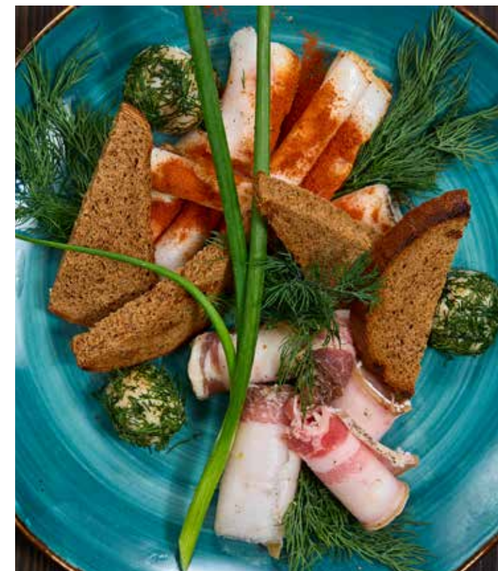
ДОМАШНЕЕ САЛО СО СМАЛЬЦЕМ ДВА ВИДА ДОМАШНЕГО САЛА, НЕЖНЫЙ СМАЛЕЦ, ПЕРЕТЕРТЫЙ С ЧЕСНОКОМ И ЗЕЛЕНЬЮ. ПОДАЕТСЯ С ТОСТАМИ ИЗ ПРЯНОГО ХЛЕБА. 420 Р 220