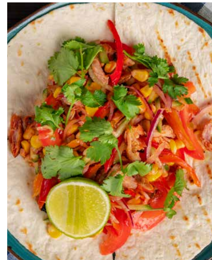
САЛАТ МЕКСИКАНСКИЙ МИКС ЛИСТЬЕВ И СВЕЖИХ ОВОЩЕЙ, СОЧНОГО КУРИНОГО БЕДРА И ОСТРОГО ПЕРЦА НА АРОМАТНОЙ ХРУСТЯЩЕЙ ЛЕПЕШКЕ. ПОДАЕТСЯ С ДОЛЬКОЙ ЛАЙМА. 380 Р 320