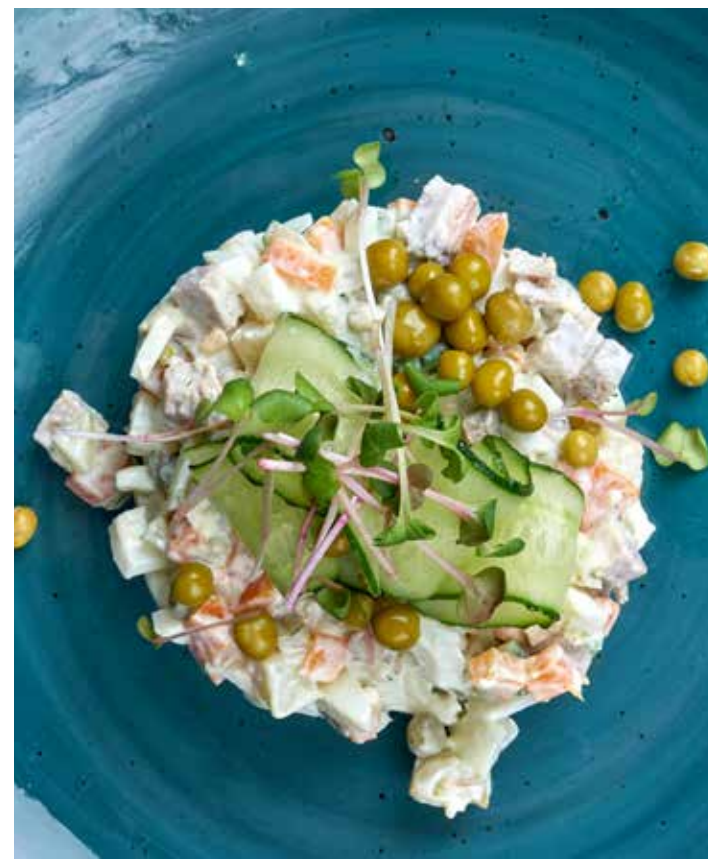
ОЛИВЬЕ С БУЖЕНИНОЙ ТРАДИЦИОННЫЙ РУССКИЙ САЛАТ ИЗ ОТВАРНЫХ ОВОЩЕЙ, СВЕЖИХ ОГУРЦОВ, КОРНИШОНОВ, ЯЙЦА И ГОРОШКА С БУЖЕНИНОЙ. 360 Р 290