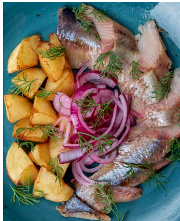
АТЛАНТИЧЕСКАЯ СЕЛЬДЬ ФИЛЕ АТЛАНТИЧЕСКОЙ СЕЛЬДИ С ОТВАРНЫМ КАРТОФЕЛЕМ И МАРИНОВАННЫМ ЛУКОМ. 320 Р 260